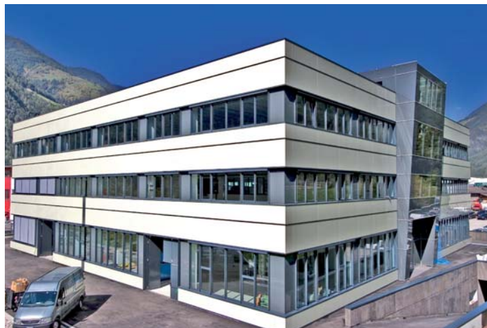
Головная контора «Цирконцан» в коммуне Гаис